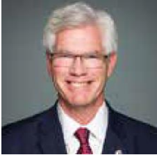
L'honorable James Gordon Carr Ministre de la Diversification du commerce international

J'ai le plaisir de vous présenter le Plan ministériel Investir au Canada 2019-2020 qui donne un aperçu général de la stratégie d'exécution et des résultats qui seront atteints au cours de la prochaine année.